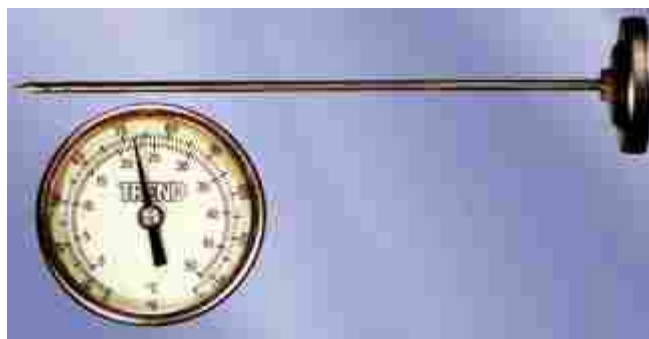
Determinación de la temperatura del concreto fresco.