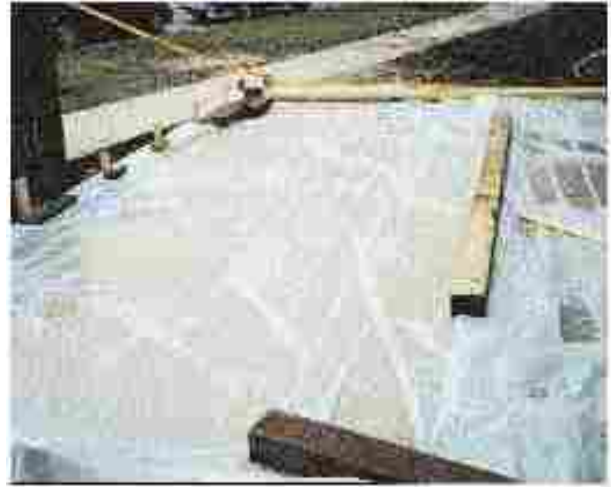
Aplicación de una película de polietileno para el curado de concreto.