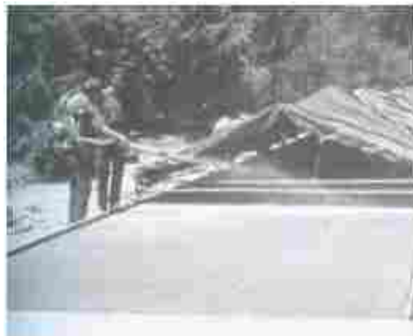
Protección del concreto contra la radiación solar.