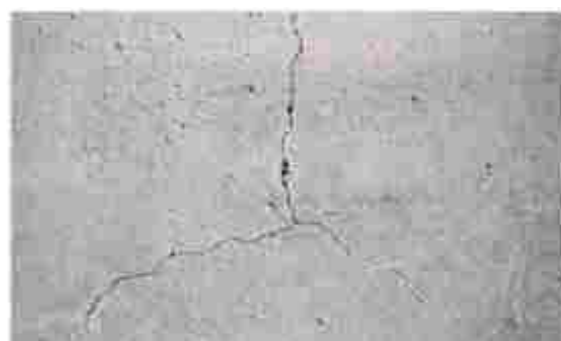
Fisura por desecación del concreto.