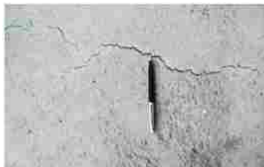
Fisura debida a la contracción plástica.