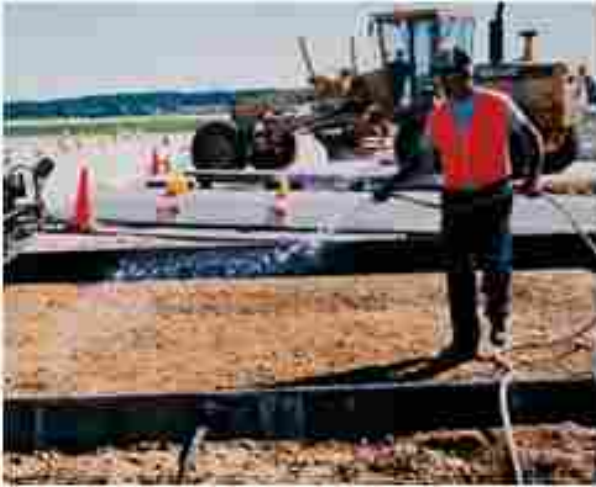
Humedecimiento de la subrasante. Para disminuir la temperatura del concreto.